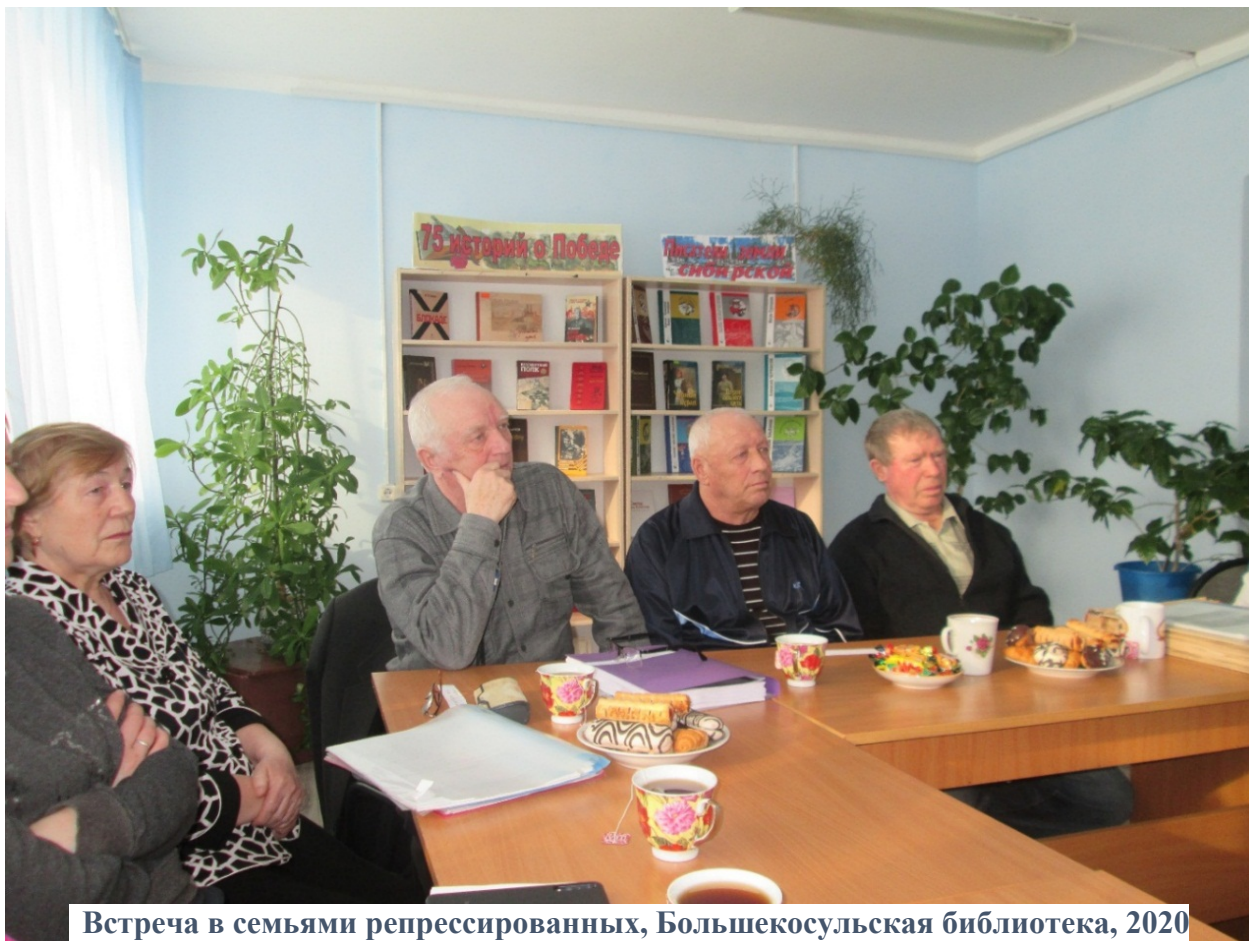
Встреча в семьях репрессированных, Большекосовская библиотека, 2020

деревню Надеженка Боготольского района. Благодаря которой был написан Альманах «Право на память».